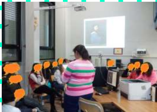
2 E e 2 F leggono l'Orlando Furioso

Così la 2 E e la 2 F della secondaria hanno preparato presentazione e azione scenica dall' Orlando Furioso ; mentre la 4B della primaria Calderini ha letto La Tempesta agli alunni della 3A.